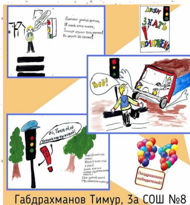
Габдрахманов Тимур, 3а СОШ №8

В детской районной библиотеке с 7 по 25 сентября был проведен дистанционный конкурс комиксов на тему «Я – пешеход!» с целью популяризации соблюдения правил дорожного движения. В конкурсе принимали участие ребята с 1 по 3 класс.